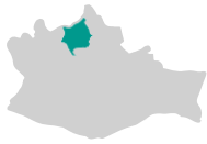
SIERRA DE FLORES MAGÓN